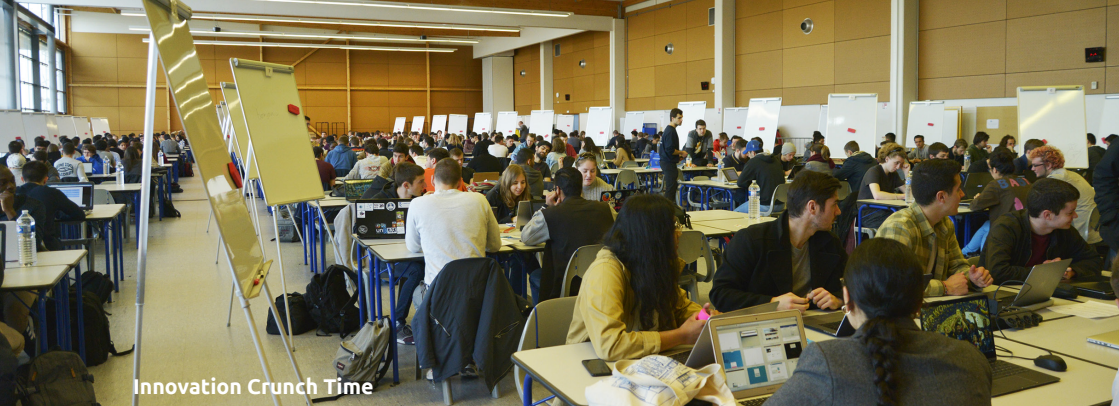
Innovation Crunch Time