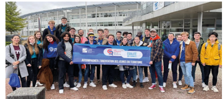
"Étudiants tuteurs UTT des Cordées de la Réussite 2021-22."

Grâce à la Fondation UTT et l'implication d'entreprises mécènes engagées, EDF, ANDRA et CIC Est, nous pouvons proposer des actions pédagogiques adaptées aux jeunes de notre territoire de la 4 ème à leur entrée dans le supérieur. Notre ambition est de leur apporter toutes les clés de réussite pour une orientation pleinement choisie et réussie.